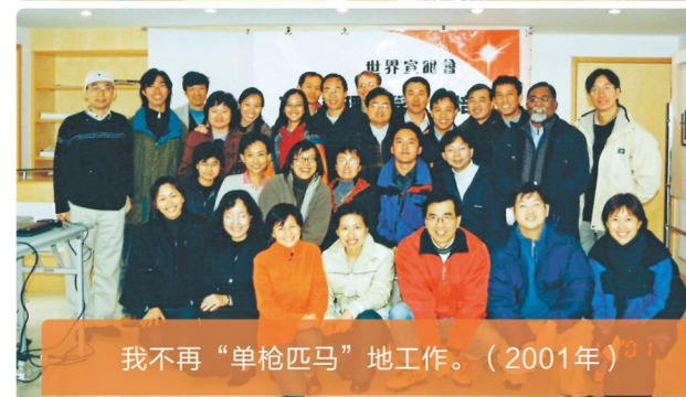
我不再“单枪匹马”地工作。（2001年）