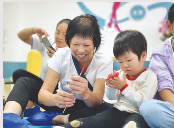
儿童与奶奶一起做手工，照顾者与孩子在“亲子互动”中有更多的互动机会。