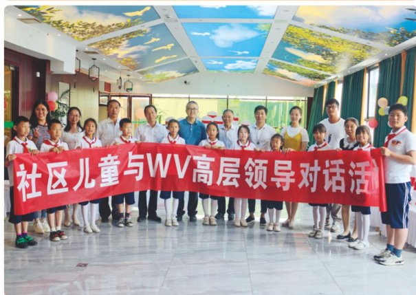
社区儿童与世界宣明会高层领导对话活动。

儿童参与权是联合国《儿童权利公约》四大基本权利之一，对所有与儿童福祉相关的决定来说，儿童的意见都极为重要。世界宣明会定期征询儿童对于社区儿童议题和项目的反馈意见，并为其提供平台，让社区成人、社区伙伴和决策者共同聆听儿童的声音。