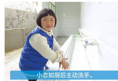
小恋如厕后主动洗手。