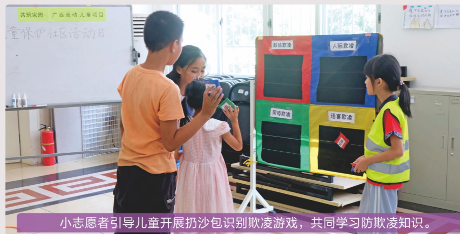
小志愿者引导儿童开展扔沙包识别欺凌游戏，共同学习防欺凌知识。

在项目活动结束后，她主动发微信告诉社工，她很庆幸当初接受了活动邀请，感受到了爱和温暖，也开阔了眼界，感受到大家对她成长的支持。