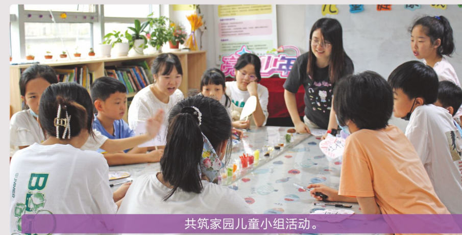
共筑家园儿童小组活动。