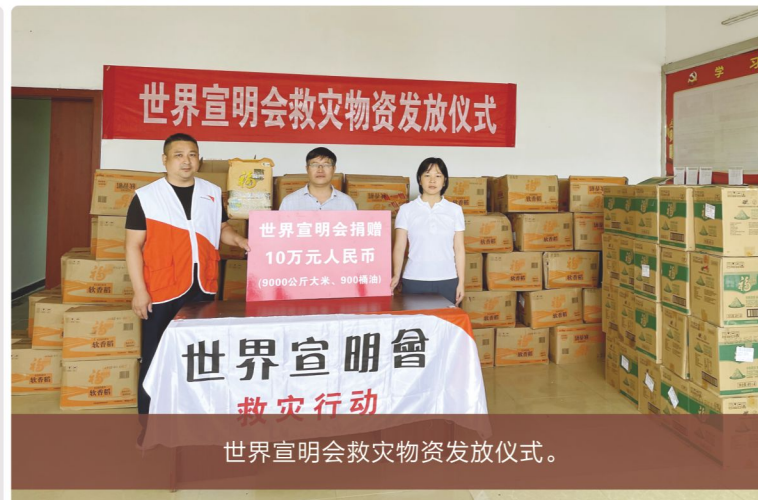
世界宣明会救灾物资发放仪式。

在回应项目中， 1,256 名儿童工作者收到了《基层儿童工作者-应急工作手册》，该手册专门针对在新冠肺炎持续爆发和限制中加剧的儿童脆弱性，以增强儿童工作者识别和回应儿童在疫情紧急情况中的特别需求的能力。