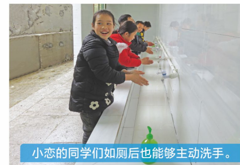
小恋的同学们如厕后也能够主动洗手。