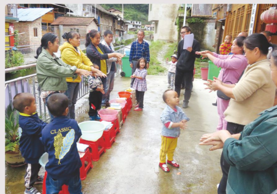
社区的家长带着孩子认真地学习正确七步洗手方法。