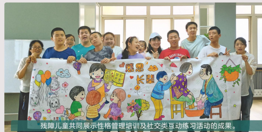
残障儿童共同展示性格管理培训及社交类互动练习活动的成果。