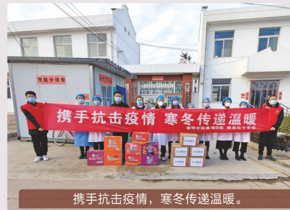
携手抗击疫情，寒冬传递温暖。