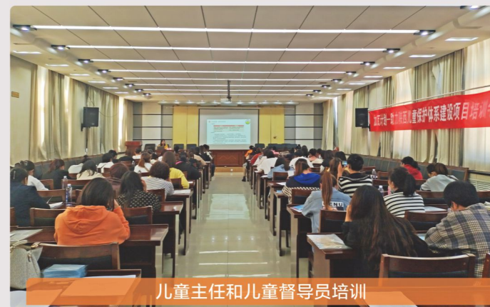
儿童主任和儿童督导员培训

云南省国际民间组织合作促进会 云南省绿色环境发展基金会 玉龙纳西族自治县和社区发展服务中心 中国乡村发展基金会 中国灾害防御协会地震应急救援专业委员会