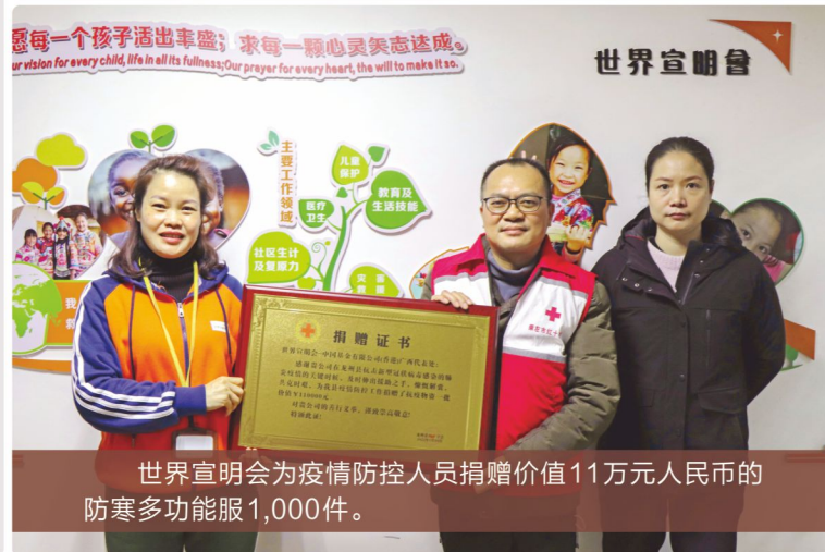
世界宣明会为疫情防控人员捐赠价值11万元人民币的防寒多功能服1,000件。