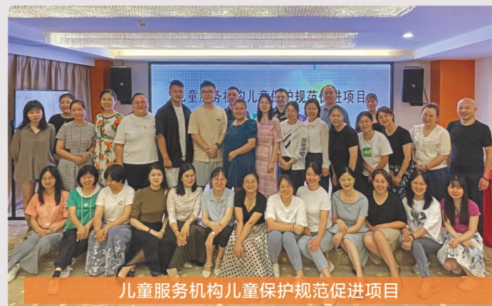
儿童服务机构儿童保护规范促进项目

南昌益心意益公益服务中心 南宁市爱之舟社会服务中心 南宁市齐悦社会工作服务中心 南宁市西乡塘区安琪之家康复教育活动中心 陕西妇女儿童发展基金会 陕西妇源汇性别发展中心 陕西仁爱儿童援助中心 陕西省社会工作协会 陕西省慈善协会及部分市县区慈善协会 陕西孝慈社会工作发展中心 石城县公益文化交流协会 石城县琴江镇小太阳儿童发展中心 天津市武清区和平之君社会工作服务中心 天津武清和平之君儿童福利院 威宁彝族回族苗族自治县草海公益协会 婺源县慈善会 西安市联众力社会工作发展中心 小云助贫中心 洋县爱家儿童家庭发展促进会 洋县壹心益社会工作者协会