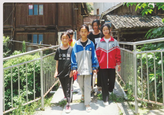
桥上加建了防护栏，孩子们每天上学走在有防护栏的桥上不再害怕掉到河里。