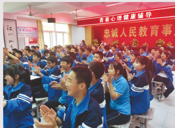
中学生们在心理健康与防欺凌知识讲座中听到精彩的环节开心地鼓掌。