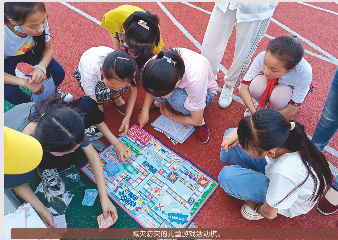
减灾防灾的儿童游戏活动棋。