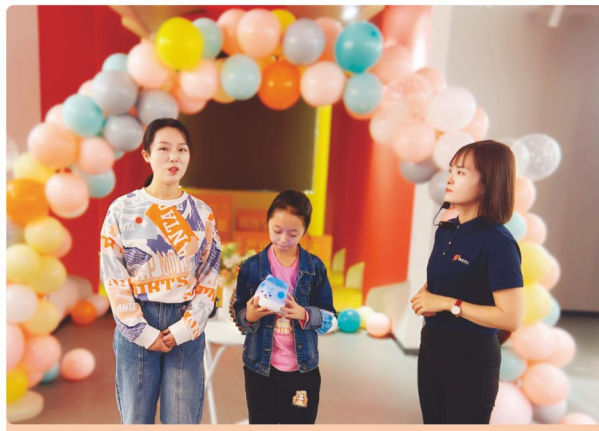
亲职教育小组结束后，女孩分享妈妈的改变。